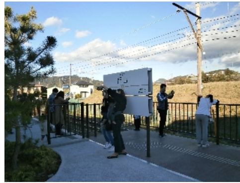
大鉄の新駅「門出」駅

更に、35年ぶりとなる大井川鐵道の新駅「門出(かどで)」駅のプラットフォームが隣接され、SLが直近で観られます。 また、SL広場では蒸気機関車[C11 312]も展示され鉄道ファンにとっても新名所になることでしょう。