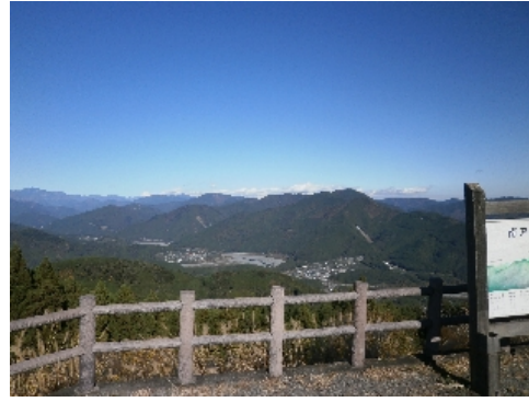
朝日段公園より南アルプスを望む

手作りのおにぎりをほうばりながら、パラグライダーが飛び立つのを今か今かと待ちわびたが、とうとう真っ青な青空を見続けるだけでした。 朝日段公園では眼下に“鵜山七曲り”と言われる約4kmにわたり大きく蛇行した美しい大井川の流れが見下ろすことができます。 全国的にも珍しい地形で、川がまるで鵜が羽ばたいているように見えることから名づけられたそうで、静岡県の天然記念物に指定されています。