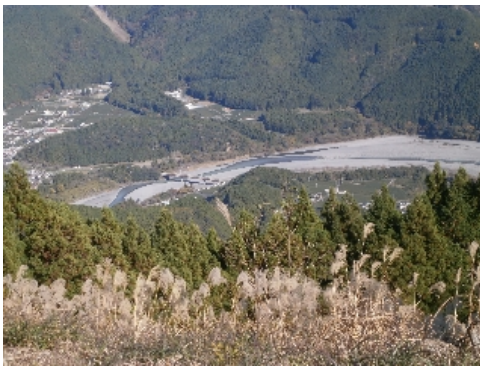
朝日段公園より“鵜山七曲り”を見下ろす

手作りのおにぎりをほうばりながら、パラグライダーが飛び立つのを今か今かと待ちわびたが、とうとう真っ青な青空を見続けるだけでした。 朝日段公園では眼下に“鵜山七曲り”と言われる約4kmにわたり大きく蛇行した美しい大井川の流れが見下ろすことができます。 全国的にも珍しい地形で、川がまるで鵜が羽ばたいているように見えることから名づけられたそうで、静岡県の天然記念物に指定されています。