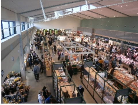
マルシェの賑わい