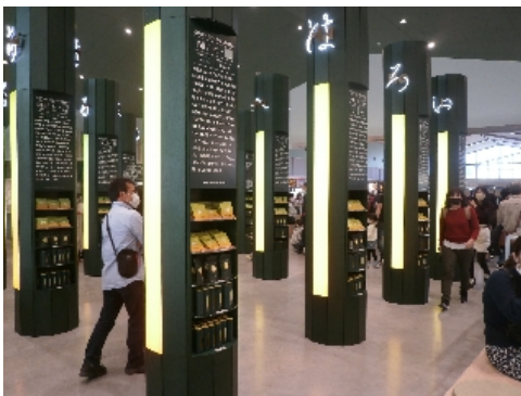
16本の大きな茶柱「MANDARA茶柱」

この「KADODE OOIGAWA」はJA大井川や大井川鐵道、島田市などが整備した緑茶・農業・観光の県下最大級の体験型フードパークです。