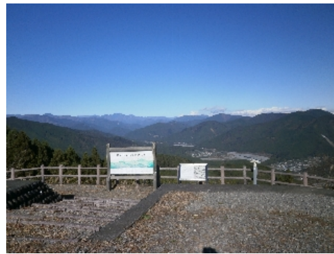
パラグライダーが舞うはずだった青空

帰路、今年11月12日(木)島田市にオープンしたばかりのKADODE OOIGAWA(かどでおおいがわ)に立ち寄ることにしました。 三連休の最終日で施設内はかなりごった返していました。