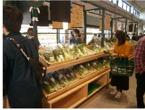
新鮮野菜コーナー