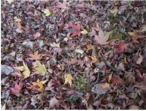
大地に還る木の葉

JR焼津駅・藤枝駅・そして島田駅にそれぞれの街のイメージイルミネーションが点灯すると、志太平洋野にも秋の深まりが訪れたことを感じます。 令和2年11月23日(月)勤労感謝の日、今日は自然の秋の深まりを探しに大井川方面に足を延ばしてみました。